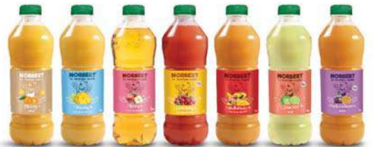
Orange Ananas Pomme Cranberry Multifruity Citron Vert Fruit de la Passion

Pour plus d'informations, rapprochez-vous de votre commercial C10.